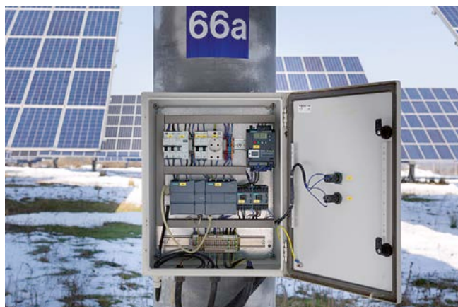
Schaltschrank am Mast

Die Informationen in dieser Broschüre enthalten lediglich allgemeine Beschreibungen bzw. Leistungsmerkmale, welche im konkreten Anwendungsfall nicht immer in der beschriebenen Form zutreffen bzw. welche sich durch Weiterentwicklung der Produkte ändern können. Die gewünschten Leistungsmerkmale sind nur dann verbindlich, wenn sie bei Vertragsschluss ausdrücklich vereinbart werden. Alle Erzeugnisbezeichnungen können Marken oder Erzeugnisnamen der Siemens AG oder anderer, zu liefernder Unternehmen sein, deren Benutzung durch Dritte für deren Zwecke die Rechte der Inhaber verletzen kann.